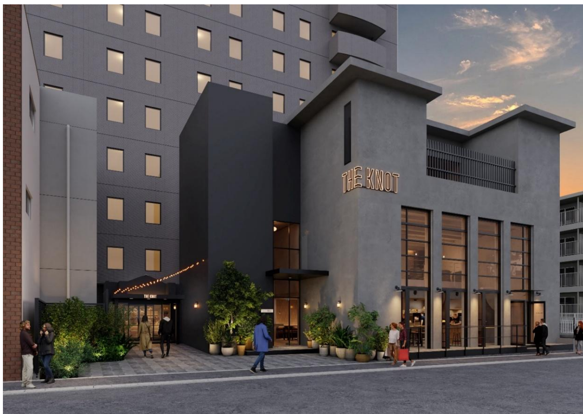
「THE KNOT FUKUOKA Tenjin」 外観

本ホテルは、「旅と人と街の結び目=THE KNOT をつくる」をテーマに展開する「THE KNOT」ブランドの第 6 弾プロジェクトです。