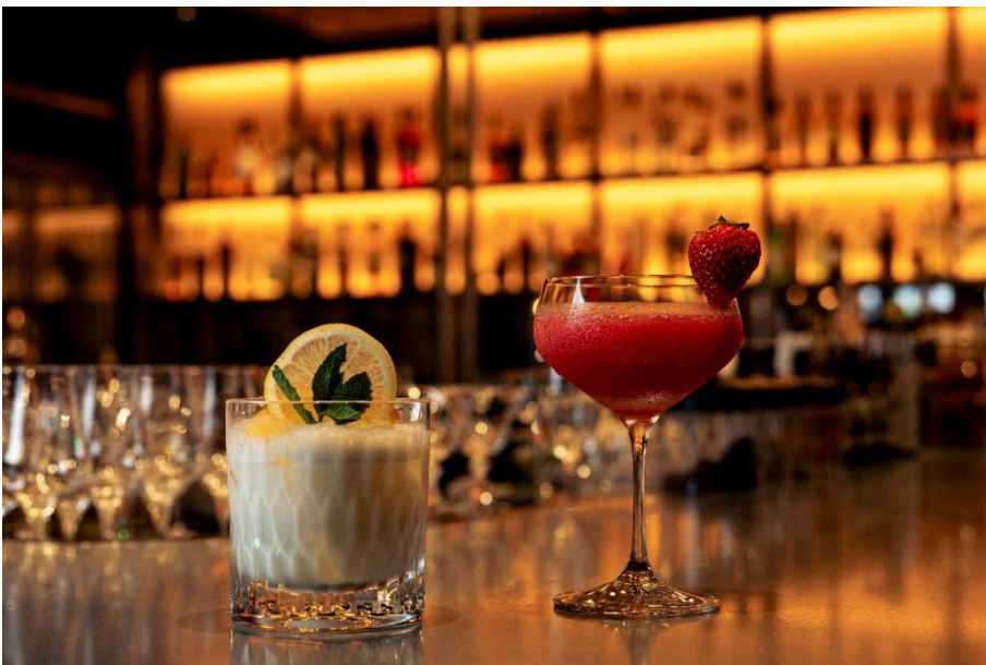
UBUYAMA Milk Piña Colada (左)、Strawberry Martini Frappe (右)