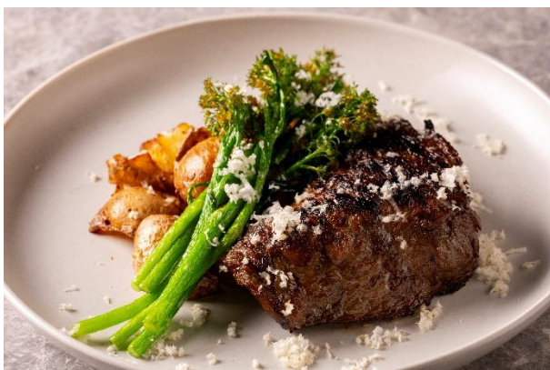
宮崎産 都萬牛のステーキフリッツ