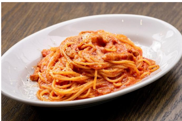
自家製スモークベーコンと新玉ねぎのアマトリチャーナ