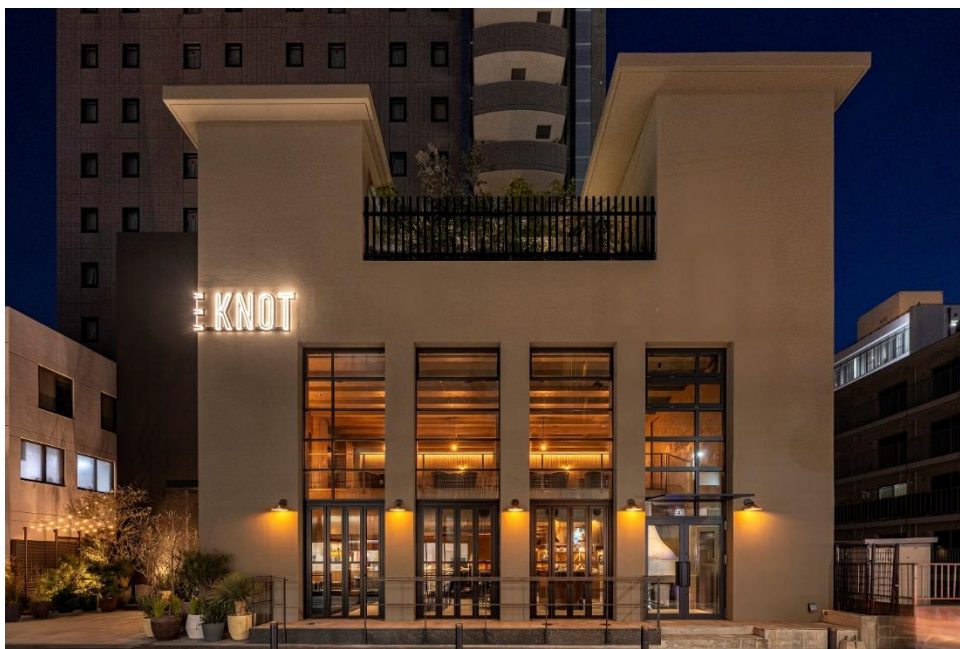
THE KNOT FUKUOKA Tenjin 外観