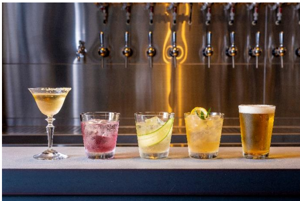
九州初のタップカクテルやクラフトビールも