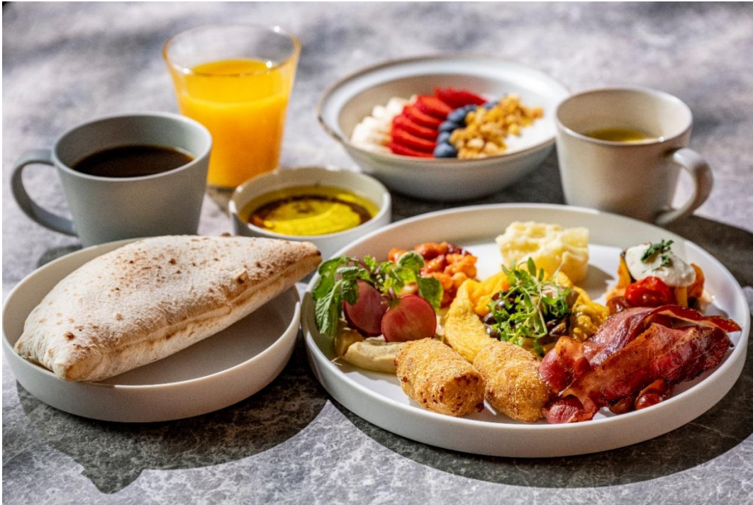
選べるメインの1つ「MORETHAN BREAKFAST PLATE」