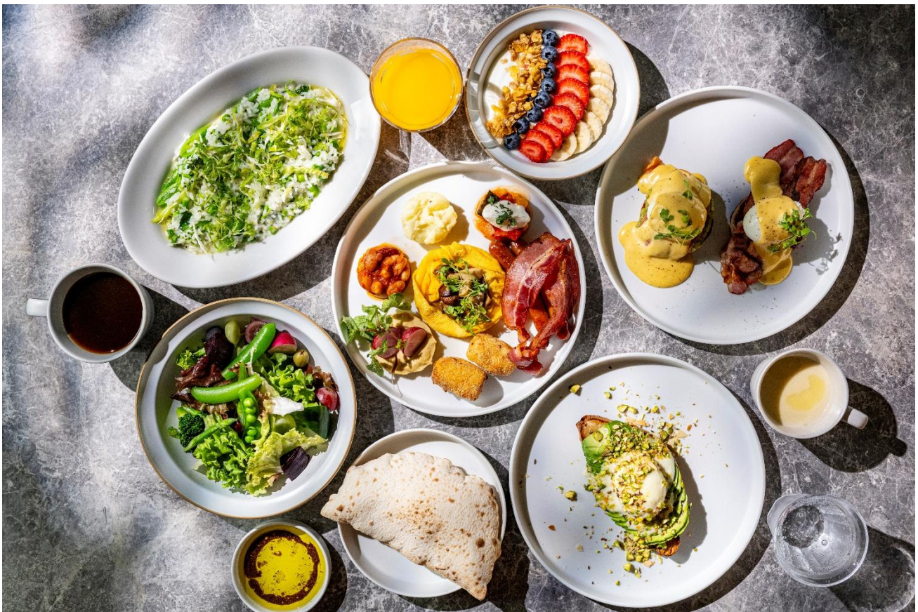
「MORETHAN CAFÉ RESTAURANT LOUNGE」選べる朝食プレート

本ホテルでは、レストランと宿泊を分けることなく、ひと続きの体験として設計。朝から夜まで営業するオールデイダイニングを核に、宿泊者に限らず、モーニングからランチ、カフェ、ディナー、バーまで自由に使える“街のサロン”として、天神・大名エリアの日常に新たな選択肢を提案します。