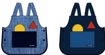
K Helly Bear Smog Vest (HJ02100) ¥8,800 [税込]

[COLOR: オフホワイト・ピンクシェル ・フォグブルー・ヘリーブルー] SIZE: 100・110・120・130・140