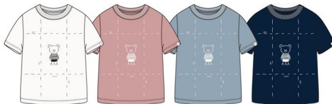
K S/S Helly Bear Tee (HJ62115) ¥4,400 [税込]

[COLOR: オフホワイト・ピンクシェル ・フォグブルー・ヘリーブルー] SIZE: 100・110・120・130・140