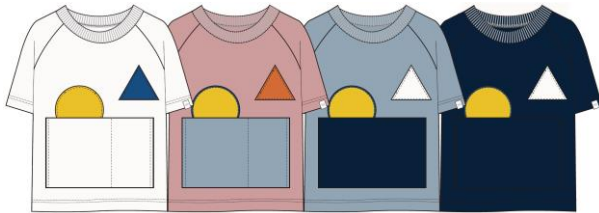
K S/S Helly Bear Pocket Tee (HJ62114) ¥4,400 [税込]

[COLOR: オフホワイト・ピンクシェル ・フォグブルー・ヘリーブルー] SIZE: 100・110・120・130・140