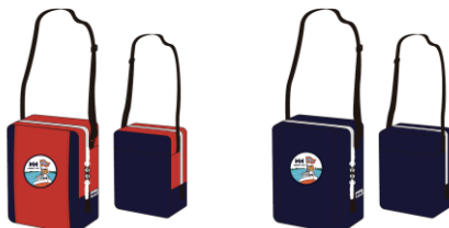
K Helly Bear Square Pouch (HOYJ92061) ¥4,620 [税込]

[COLOR: レッド・ヘリーブルー] SIZE: W130mm×H170mm×D75mm