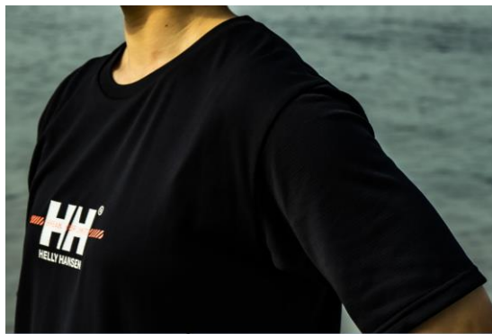
LIFA S/S Training Tee [HE32201] 6,380円（税込）

汗のべたつきを抑えてくれるLIFA ® Tシャツシリーズです。肌離れがよいグリッド上の生地を採用し、サラッとした着心地です。トレーニングによってヒートアップした身体は、LIFA ® の保温性とキシリトール加工が、クールダウンを助けます。トレーニングから普段着でも着用できるようなシルエットです。