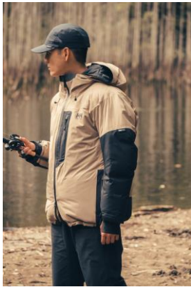
HHAngler WP Down Jacket (HG12260) ¥74,800 (税込) [SIZE : M · L · XL]

遠赤外線効果で自然な暖かさが持続する光電子®をミックスしたダウンを、330g (Lサイズ)とたっぷり封入したハイロフトタイプです。ダウン入りのハイネック設計で、首回りも暖かいデザインになっています。フロントの内側には中わたを封入したチューブを配置し、袖口はダブルカフ仕様により冷気の侵入を軽減するなど、高い保温性にこだわったディテールです。左胸の止水ファスナー付きポケットは、携帯電話などの収納に重宝します。フロント内側には、メッシュポケットや小物をまとめやすいキーポケットを備え、胸と腰裏には、小さめの使い捨てカイロが収納できるサイズの隠しポケットが付いており、細部までこだわった、暖かさと機能性を備えたダウンジャケットです。