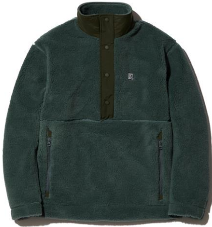
FIBERPILE® Hybrid Jacket [HE52173] ¥22,000（税込）

ボア感のあるクラシカルな風合いで、毛足が短く肌触りと保温性に優れた特徴をもつのが、ファイバーパイルです。環境配慮型素材「GREEN MATERIAL」のリサイクル糸を使用しており、胸元から襟元にかけてナイロン素材の切り替えを施しています。襟元は、冷たい風が入りにくいスタンドネックのデザインをあしらい、両サイドは、手を入れると暖かいハンドウォーマーポケットに。ポケット上部の舟型デザインがさりげないアクセントになっています。また、ハイブリッドパンツ（HE22175）とセットアップとして着用が可能です。