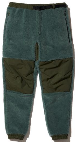
FIBERPILE® Hybrid Pants [HE22175] ¥22,000（税込）

ハイブリッドジャケットと同素材を使用したハイブリッドパンツです。異素材を組み合わせたパンツは、暖かさと動きやすさが特徴で、膝とヒップ部分はナイロン素材に切り替えを施しています。膝部分には、薄中わたを封入することで、脚の動きを妨げにくく、補強にもなっています。両サイドのポケットは、上部の舟型デザインをアクセントに、シルエットはテーパードですっきりと見えるよう仕上げています。また、ハイブリッドジャケット（HE52173）とセットアップとして着用が可能です。