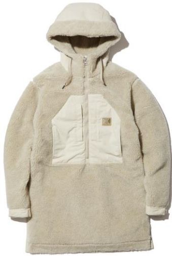
Flameproof Wool FIBERPILE ® THERMO Long Jacket [HOE52185] ¥46,200 (税込)

ファイバーパイルサーモに、ウールを加え、さらに難燃性をもたせたロングジャケットです。ボア感のあるクラシカルな風合いはそのままに、ウールを加えたことで、保温力にプラスして調温調湿性といった機能も備えた、快適な暖かさが魅力です。火の粉に触れても燃え広がりにくい難燃性は、冬のキャンプなどの焚き火シーンでも活躍。腕裏や背面下部にあしらった別布にも、難燃性生地を使用しています。両サイドのファスナーはベンチレーションになるだけでなく、キャンプシーンでローチェアに腰かけたときの前身頃のもたつきを軽減します。ヨットの帆の形をイメージした胸ポケットや、身生地と同色のヘリテージロゴなど、タウンユースでもコーディネートしやすいデザインに仕上げています。