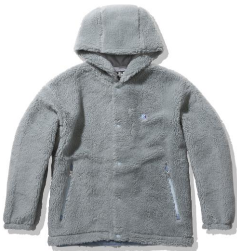
FIBERPILE® THERMO Coach Jacket [HOE52184] ¥ 28,600 (税込)

コートと同素材を使用し、防風性のある裏地と組み合わせたコーチジャケットは、寒いシーズンのアウターとして活躍します。シルエットはトレンド感のあるややゆったりめのシルエットで、タウンユースでのコーディネートがしやすいデザインに仕上げています。