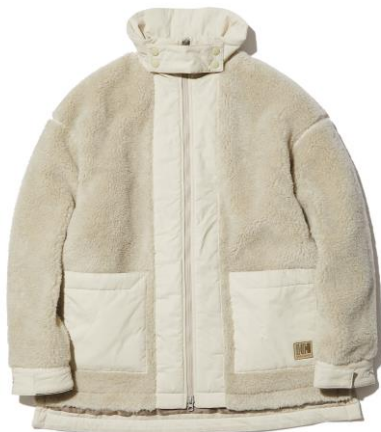
Flameproof Wool FIBERPILE ® THERMO Jacket [HOE52186] ¥44,000 (税込)

ロングジャケットと同素材を使用したジャケットです。襟を立ててタブで留めるとスタンドネックに変化し、首元からの冷えを防ぎます。トレンド感のあるややゆったりめのシルエットで、身生地と同色のヘリテージロゴをあしらうなど、タウンユースしやすいデザインに仕上げています。