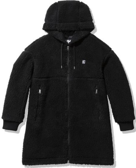
FIBERPILE® THERMO Coat [HOE52182] ¥ 33,000 (税込)

ポア感のあるクラシカルな風合いが特徴のファイバーパイルをベースに、より厚手で保温力を向上させたのが、ファイバーパイルサーモです。環境配慮型素材「GREEN MATERIAL」のリサイクル糸を使用しており、防風性のある裏地と組み合わせた長め丈のコートは、寒いシーズンのアウターとして活躍します。また、両サイドのポケットは、上部の舟型デザインがさりげないアクセントになっています。