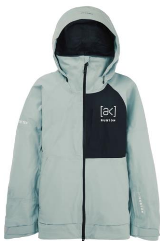
ウィメンズ Burton [ak]® キミー GORE-TEX 3L ストレッチジャケット ¥ 80,000 (税込 ¥ 88,000)