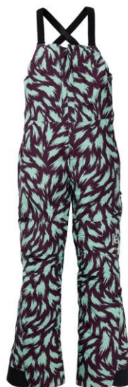
ウィメンズ Burton [ak]® キミー GORE-TEX 2L ビブパンツ ¥ 65,000 (税込 ¥ 71,500)