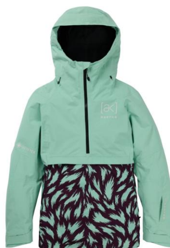
ウィメンズ Burton [ak]® キミー GORE-TEX 2L アノラックジャケット ¥ 58,000 (税込 ¥ 63,800)