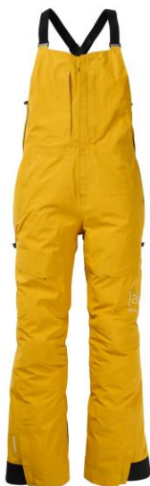
ウィメンズ Burton [ak]® キミー GORE-TEX 3L ストレッチビブパンツ ¥ 86,000 (税込 ¥ 94,600)