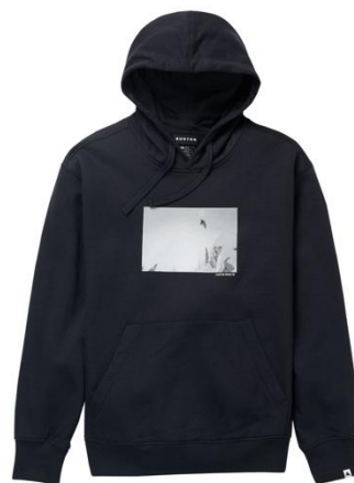
Burton Custom 30周年 ブルオーバーフーディー ¥ 16,000 (税込 ¥ 17,600)