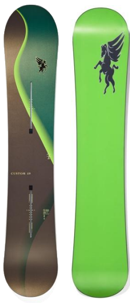
Burton Custom 30周年 キャンバー スノーボード 正規ディーラー限定モデル (サイズ 159)