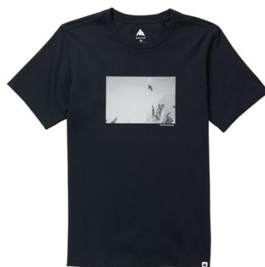
Burton Custom 30周年 ショートスリーブ Tシャツ ¥ 8,000 (税込 ¥ 8,800)