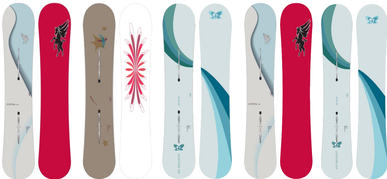
Burton Custom 30周年 キャンバー スノーボード (サイズ 144 / 149 / 155 / 159 / 164)