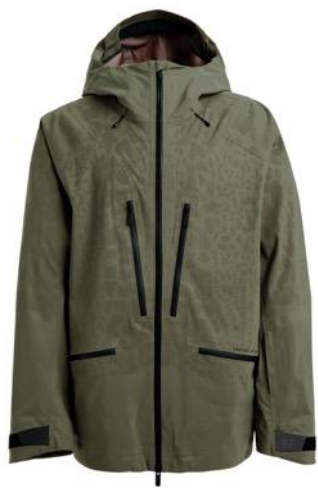
MINE77 2D WARP 3L ジャケット