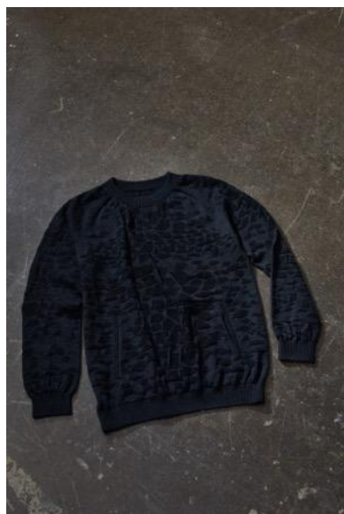
MINE77 3D ニット メリノ ミッドレイヤー トップス