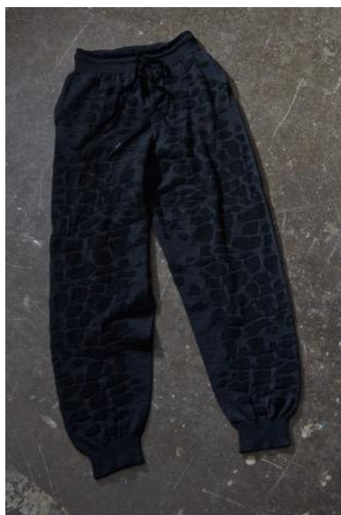
MINE77 3D ニット メリノ ミッドレイヤー パンツ