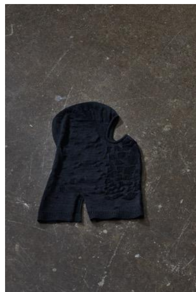
MINE77 3D ニット メリノ バラクラバ