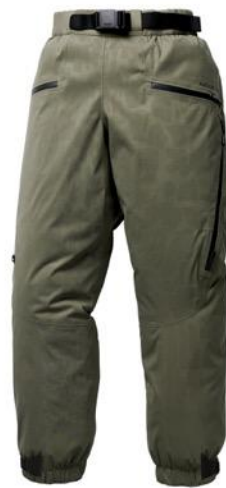
MINE77 2D WARP 3L パンツ