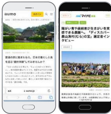
メディア媒体(アウモ、マイナビ)での記事掲載