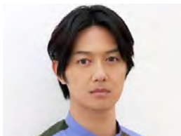
工藤 阿須加氏 (俳優)