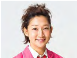
虻川 美穂子 氏 (タレント/北陽)