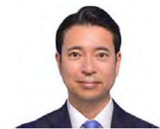
高山 成年 (農林水産省大臣官房政策課長)