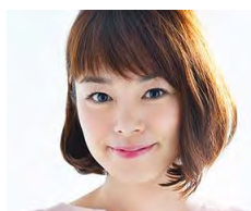
川瀬 良子氏 (タレント)