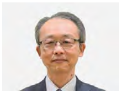
渡邊 毅 (農林水産省 大臣官房長)

2日間に渡る「NIPPON FOOD SHIFT FES.東京 2023」のオープニングとして、関係者による挨拶と出演者・出店者による開会宣言を行います。