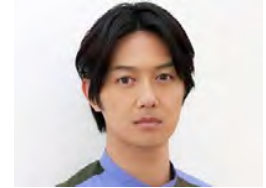
工藤 阿須加氏 (俳優)