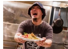
墮天使かっキー 氏 (「墮楽暮」店主)