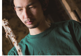
納豆マルシェ・極！