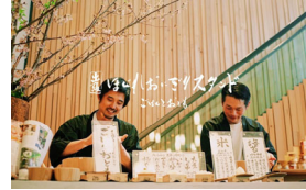
ほぐれおにぎり スタンド