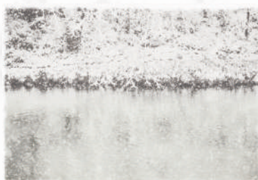
Itadori river, Mino, Japan / Size : 379 x 288mm Year : 2021 / Ed.5 / ink, photography Hon-Mino-shi paper (本美濃紙)

NIPPONIA 美濃商家町に新しいギャラリー「GALLERY COLLAGE」がオープンしました。そこで、この度柿落としとして、世界的な現代美術家であるシーズン・ラオ氏を招聘し、美濃の要素を取り込んだ新作展を開催する運びとなりました。