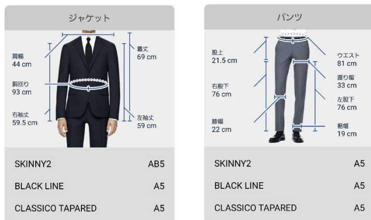
採寸結果のサンプル画面

アプリが採寸したサイズをもとに、全国の SUIT SELECT でオーダースーツの注文ができたり、店内の各種スーツの最適なスタイル・サイズを見つけることができます。