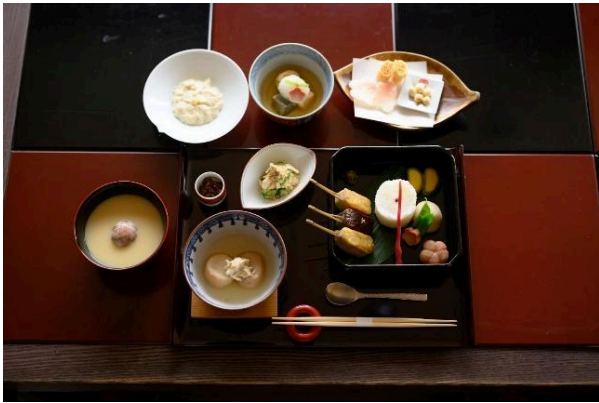
豪華なむし養いコース