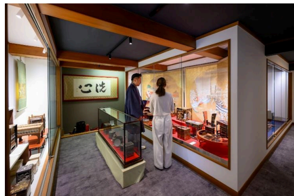
貴重な展示品が並ぶ資料室