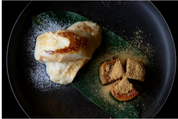
Otonami限定の麩レンチトースト(左)