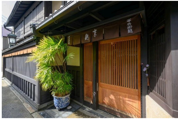
築120年を超える京町家と昭和の洋式建築を融合した趣ある「半兵衛麩 本店」