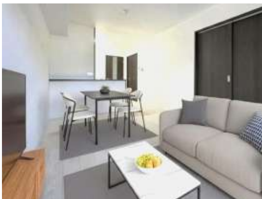
リビング※イメージ