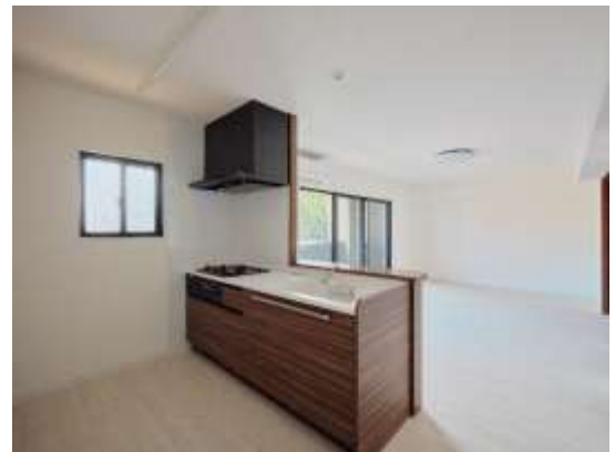
キッチン・リビング