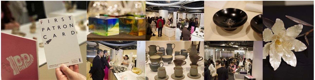
ファースト・パトローネージュ・プログラム 2019 会場の様子