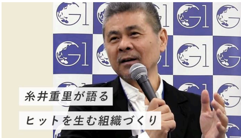
糸井重里が語るヒットを生む組織づくり