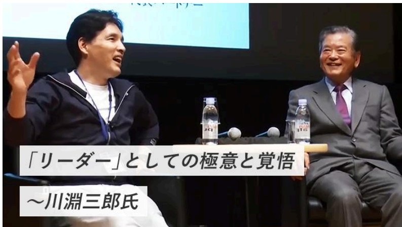
「リーダー」としての極意と覚悟～川淵三郎氏