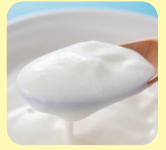
ヨーグルト エキス※6

※1 汚れや古い角質を落とすことによる ※2 汚れや古い角質 ※3 パック時間の目安(1~2分) ※4 カオリン(洗浄補助成分) ※5 グルコノバクター/ハチミツ発酵液(整肌成分) ※6 ヨーグルト液(牛乳)(整肌成分)