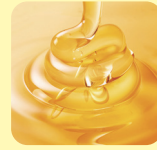
発酵ローズ はちみつ※5