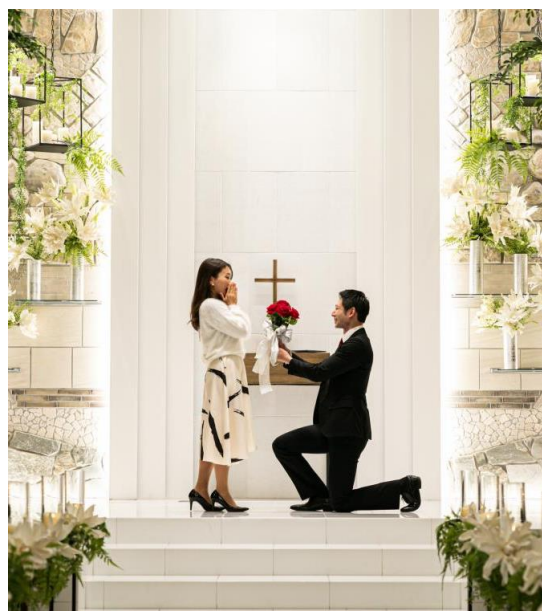
▲表参道のケヤキ並木をイメージした幻想的なチャペルを貸し切ったサプライズプロポーズ

表参道のメインストリートを臨む、ニューヨークのダンボ地区をイメージしたスタイリッシュなレストランにて、シェフ特製のスペシャルディナーコースをご堪能いただいた後、併設された幻想的なチャペルを贅沢に貸し切ったサプライズ感のあるプロポーズを演出していただけます。