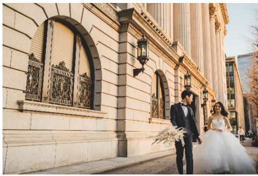
丸の内 明治生命ビル付近