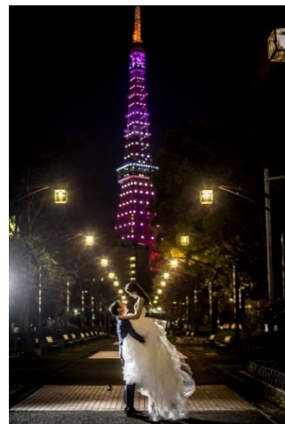
東京タワー付近でのシーン

内容: 新郎新婦衣裳2着、着付け料、新郎新婦ヘアメイク支度料、撮影料(150カットレタッチデータ、 1着につき1.5時間、納品期日1週間)、撮影ロケーション(雨天時スタジオ)、ウェルカムボード