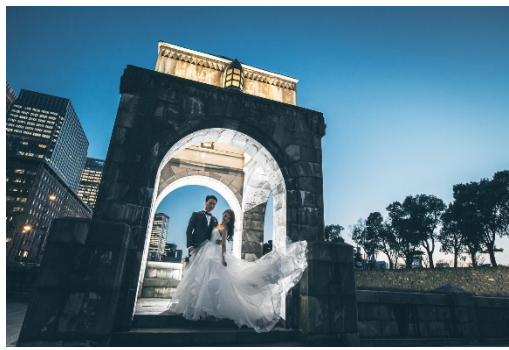
丸の内 行幸通り付近