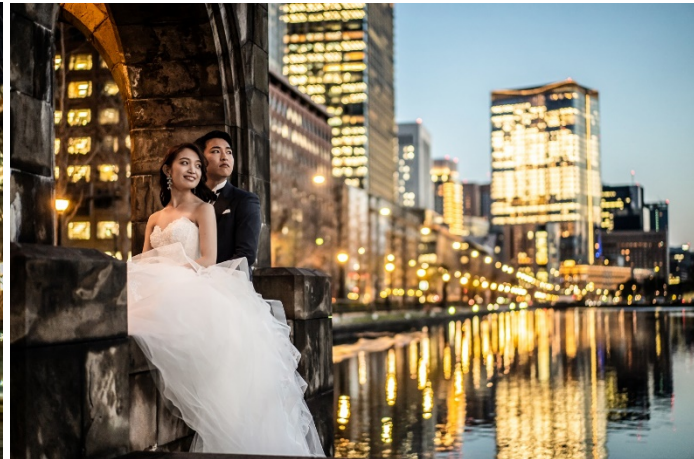
東京駅や東京タワーなどご希望をお伺いしてロケーションを決定 (左)東京駅前 (右)丸の内周辺