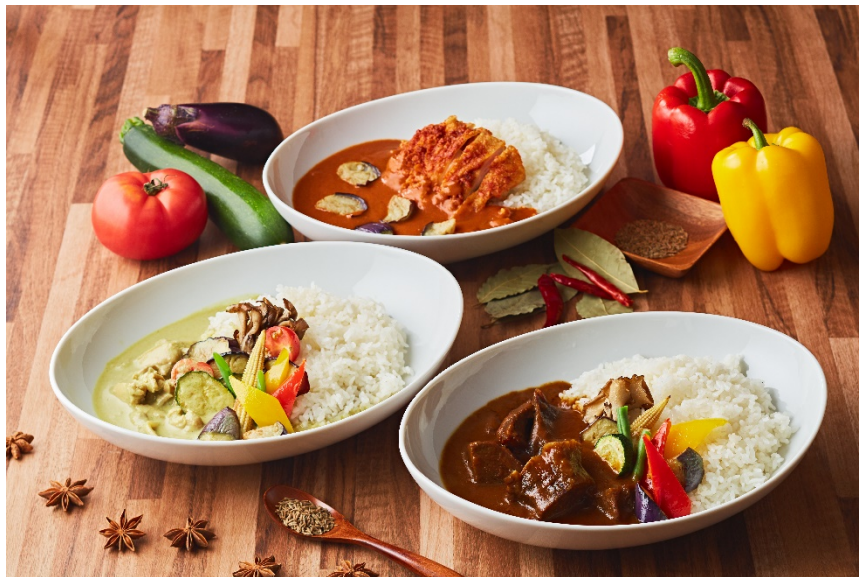
ホテルのシェフが作る本格的な3種類のカレー

販売期間: 2021年8月31日(火)まで 場所: ニューヨークラウンジ By インターコンチネンタル 東京ベイ、ハドソンラウンジ他