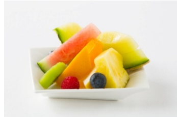
スモールフレッシュフルーツ ¥550