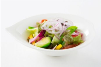
スモールグリーンサラダ ¥550