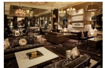
ニューヨークラウンジ 内観

上質なインテリアの中にゆったりとお掛けいただけるソファ席を配した華やかな店内では、見た目にも鮮やかな美食を提供します。一角に設けられたデザート工房「アトリエ・デセール」で仕上げられるアフタヌーンティーやパフェ、パンケーキなどのスイーツの他、サンドイッチやハンバーガー、各種御膳など、軽食からしっかりしたお食事までさまざまな用途に対応できるバラエティ豊かなメニューをご用意しております。各種アルコールも取り揃えておりますので、夜はバーラウンジとしてもお楽しみいただけます。