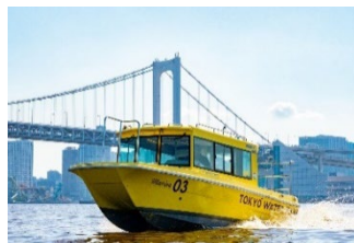
都会の水上散歩が楽しめる 東京ウォータータクシー

https://www.interconti-tokyo.com/stay/plan/water-taxi.html