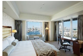
エグゼクティブフロア リバービュー