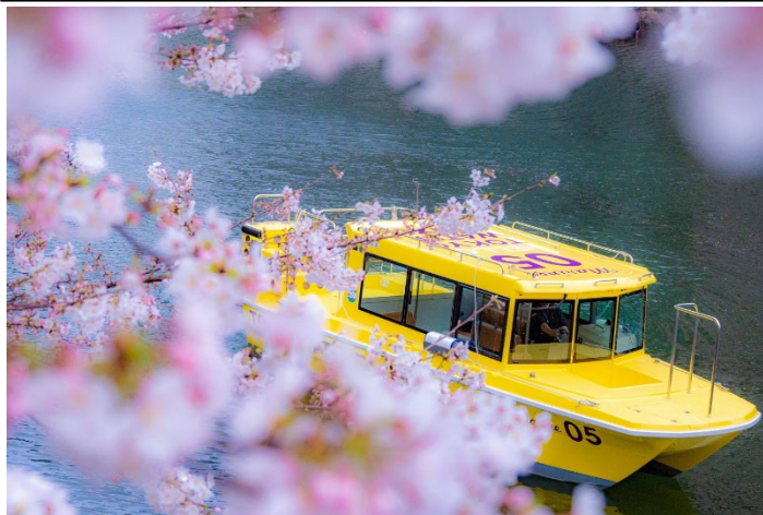
東京ウォータータクシーでのお花見クルーズが付いた宿泊プランが登場