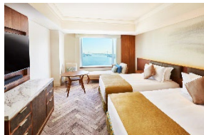
デラックスフロア ベイビュー