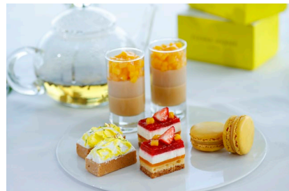
サマーフルーツをふんだんに使用したスイーツ