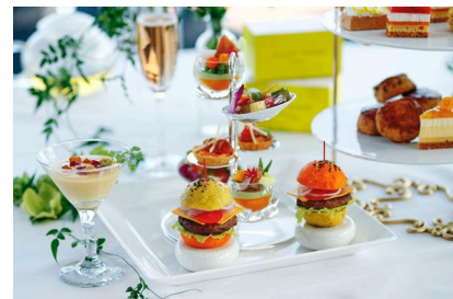
旬の素材を使った彩り豊かなホテルオリジナルセイボリー