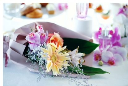
お好きな胡蝶蘭と季節の生花を使い、 フラワーアレンジメント体験が楽しめる

コーヒー4種、アイスコーヒー、アイスカフェオレ、アイスティー、日本茶2種、 中国工芸茶3種、クラシックティー2種、ハーブティー4種、フレーバードティー4種