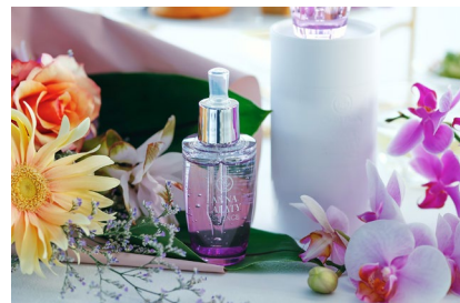
胡蝶蘭のエキスをふんだんに使用した 至極の美容液「ANNA LALATY」