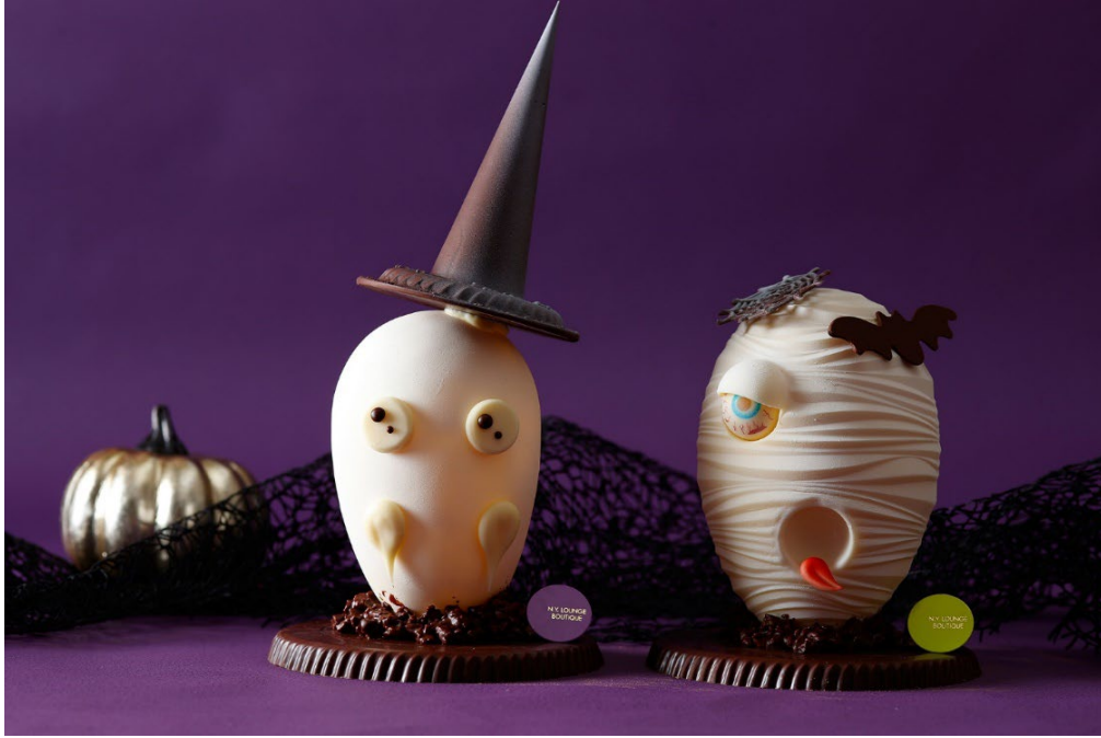
遊び心あふれるハロウィンの時期ならではのユニークなチョコレートスイーツが登場

販売期間:2023年9月15日(金)~10月31日(火) 場所:ザ・ショップ N.Y.ラウンジブティック