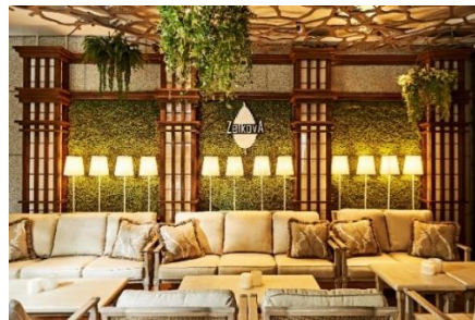
テラス ソファ席(イメージ)

https://www.strings-group.jp/omotesando/event/terrace-event.html