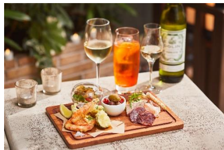
ライトミール(イメージ)