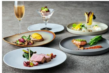
開業6周年記念コース(イメージ)