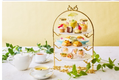
(上) SABONアメニティセット (下) アフタヌーンティー例