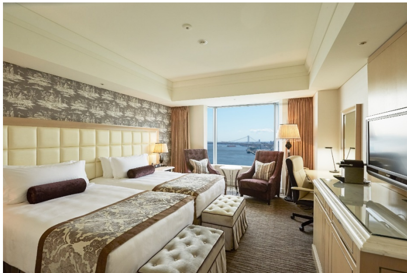
「エグゼクティブフロア」客室イメージ