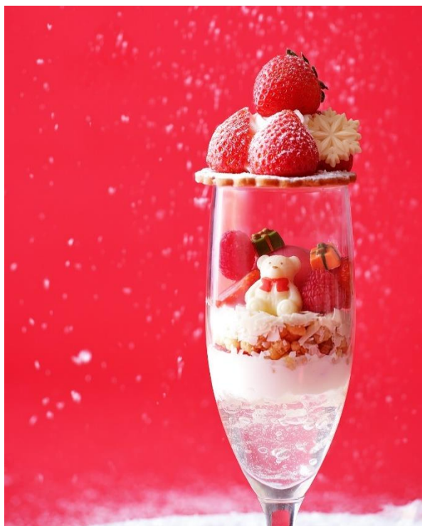
スノードームに見立てたパフェは雪が降りしきるクリスマスの銀世界を演出

クリスマス为主题にした見た目も愛らしい冬限定のスイーツを2種ご用意いたしました。