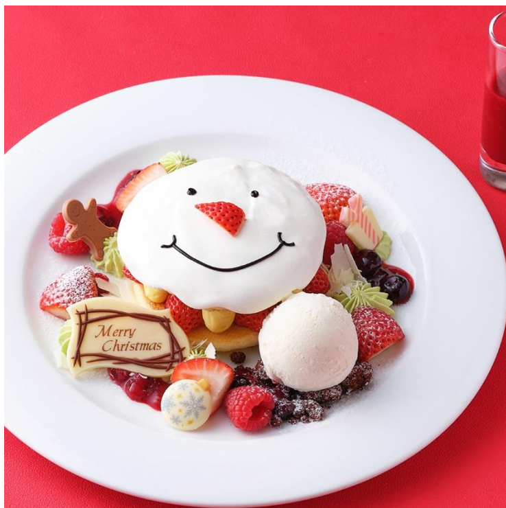
スノーマンと賑やかなクリスマスリースをイメージしたパンケーキ

ザ スtrings 表参道(所在地:東京都港区北青山3-6-8、総支配人:宮田宏之)では、1階「Cafe & Dining Zelkova (カフェ&ダイニング ゼルコヴァ)」にて、クリスマスを彩る冬限定のスイーツ『スノーマン パンケーキ』と、『スノードーム パフェ』を、2023年11月1日(水)~12月25日(月)まで提供いたします。毎年好評のスノーマン パンケーキは、スノーマンと賑やかなクリスマスリースをイメージしたデコレーションになり本年度も登場。スノードーム着想のパフェは、グラスの中に可愛らしいホワイトベアやクリスマスギフトボックスを閉じ込め、雪が降りしきるクリスマスの銀世界を演出いたします。