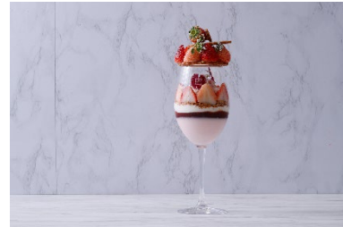
パフェのトップには帽子をイメージした、白いちごとあまおうのプティガトーをのせた

https://www.interconti-tokyo.com/dining/plan/strawberry_parfait.html