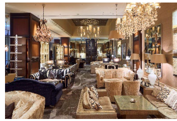
ニューヨーククラウンジ 内観

上質なインテリアの中にゆったりとお掛けいただけるソファ席を配した華やかな店内では、見た目にも鮮やかな美食を提供します。一角に設けられたデザート工房「アトリエ・デセル」で仕上げられるアフタヌーンティーやパフェ、パンケーキなどのスイーツの他、サンドイッチやハンバーガー、各種御膳など、軽食からしっかりしたお食事までさまざまな用途に対応できるバラエティ豊かなメニューをご用意しております。各種アルコールも取り揃えておりますので、夜はバーラウンジとしてもお楽しみいただけます。