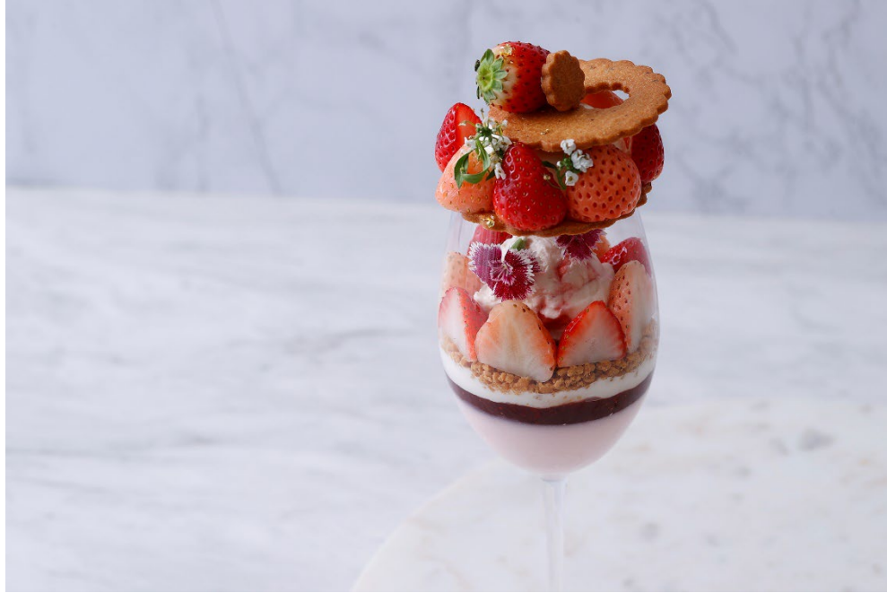
これから旬を迎える白いちごとあまおうを贅沢にアレンジした、キュートなフォルムが目を惹くパフェ

期間：2023年12月1日(金)～2024年2月29日(木) 場所：ニューヨークラウンジ、ハドソンラウンジ