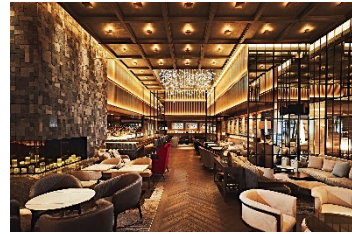
ハドソンラウンジ 内観

2020年にグランドオープンした「逢う・集う・囲む」をコンセプトにした開放的かつダイナミックなラウンジ&バー。天井高5mの「火を囲む暖炉のあるラウンジ」を空間の中心とし、7mのカウンターを備え、光と影が演出するアーティスティックで魅惑的なバーエリア「アンバー」と、ソファ席や洛中洛外図を設置したラウンジエリア、ライブラリーの落ち着いた雰囲気を出し出すエリア「ザ ライブラリー」、会食や接待、ミーティングにもご利用いただけるプライベートルーム「ライト」「エジソン」を完備した、人と人の交わる、当ホテルの新たなシンボルラウンジです。