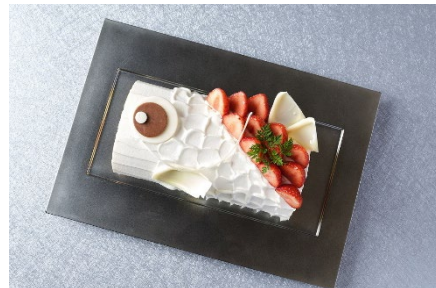
「鯉のぼり」をモチーフにしたロールケーキをご用意