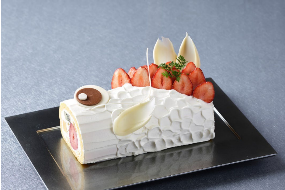
真っ白なシャンティを纏い、4種のフルーツをふんだんに使用した華やかな「こいのぼりケーキ」

期間:2024年4月20日(土)~5月6日(月・祝) 場所:ザ・ショップ N.Y.ラウンジブティック