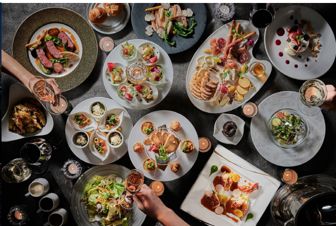
ルーフトップバー IN Tokyo Bay パーティープランは 前菜からデザートまで大皿料理で楽しめる

ホテル インターコンチネンタル 東京ベイ(所在地:東京都港区海岸1丁目16番2号、総支配人:宮田 宏之)では、レインボーブリッジビューダイニング&シャンパンバー マンハッタンにて、10月31日までの期間限定で、シャンパンやビールをフリーフローで楽しめるプランと、コース仕立ての料理を大皿でお届けするテラス席確約プランやダイニングプランをご用意いたしました。