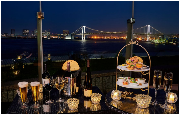
レインボーブリッジの夜景とともにシャンパンやビールを 思う存分楽しめるフリーフロープラン

販売期間：2024年5月17日(金)～10月31日(木)まで 場所：レインボーブリッジビューダイニング&シャンパンバー マンハッタン