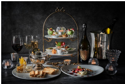
フレンチテイストの彩り豊かなオードブル、キャビア、デザートが付いたフリーフロープラン