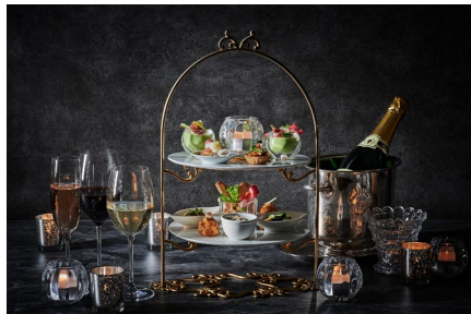
フレンチテイストの彩り豊かなオードブルが付いたフリーフロープラン

*モエ・エ・シャンドン アイス アンペリアル2種の提供は2024年7月31日(水)まで