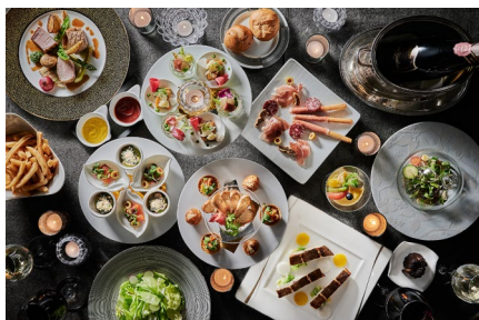
ルーフトップバー IN Tokyo Bay パーティープラン (料理イメージ)