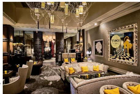
ニューヨーククラウンジではハロウィン期間中 イエローラベルにラッピング(イメージ)

https://www.interconti-tokyo.com/dining/plan/champagne-veuve-clicquot_2024.html