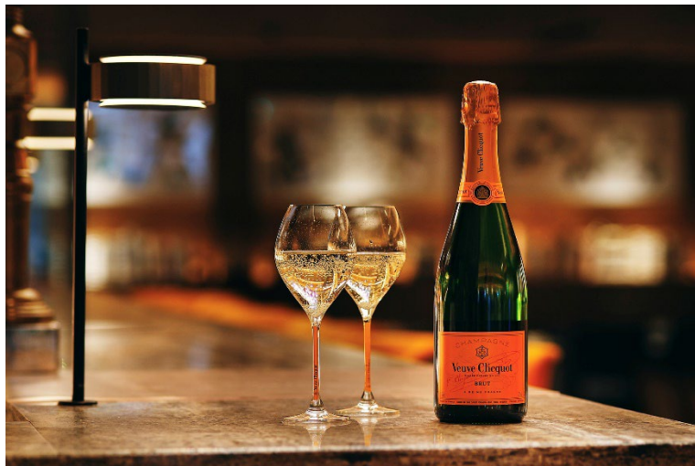
イエローラベル ブリュットとローズラベルはグラス1杯から楽しめる