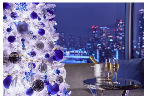
ロマンティックな水辺の夜景を楽しむ客室