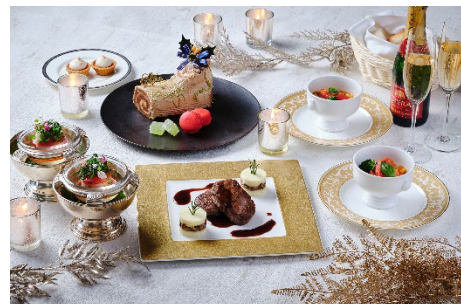
クリスマススペシャルディナー(イメージ)