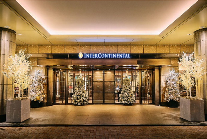
聖なる夜をロマンティックに彩るクリスマスステイプランを用意