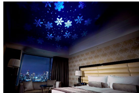
スノーホワイトルームには幻想的な雪の結晶が投影される