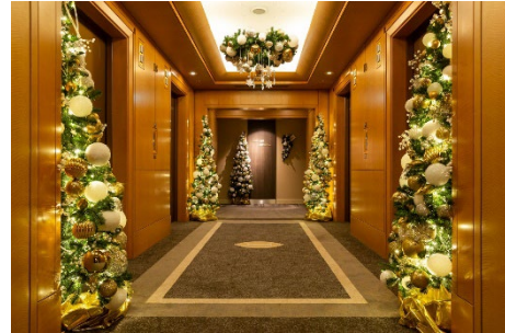
華やかなデコレーションが目を惹くクリスマスフロアのエレベータホール