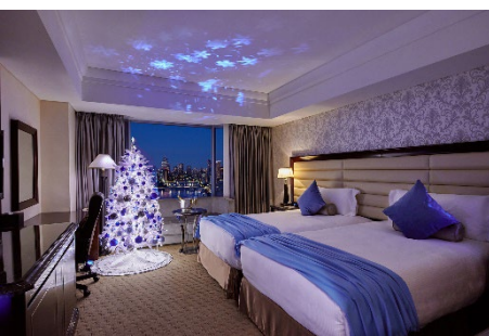
クリスマスフロアの客室(イメージ)