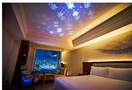
スノーホワイトルーム(イメージ)