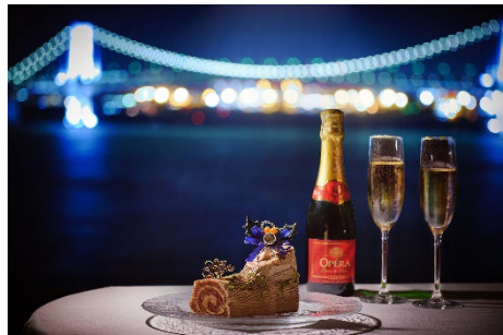
クリスマスケーキとスパークリングワイン(イメージ)