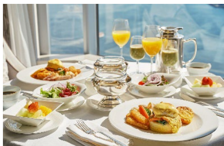
デラックスブレックファスト(イメージ)