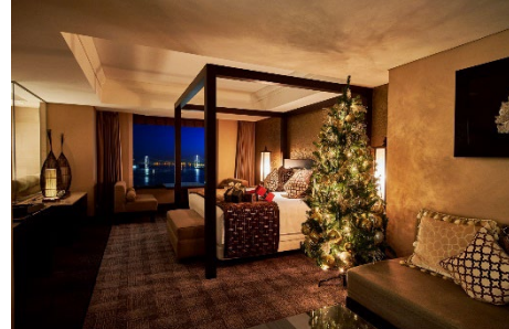
クリスマスツリーが飾られたデザイナーズスイート&ルーム(写真はラグジュアリーオリエンタル)