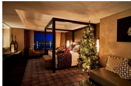
クリスマスツリーが飾られたデザイナーズスイート&ルーム (写真はラグジュアリーオリエンタル)