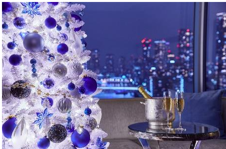
ロマンティックな水辺の夜景を楽しむ客室