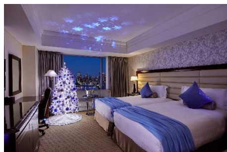
クリスマスフロアの客室(イメージ)