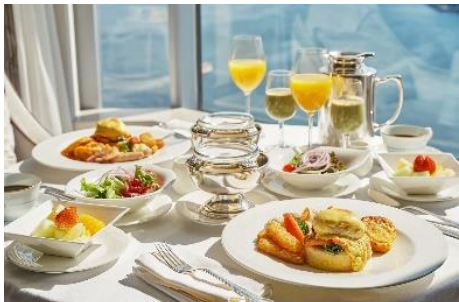
デラックスブレックファスト(イメージ)