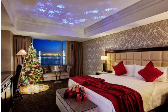
聖なる夜をロマンティックに彩るクリスマスステイプランを用意