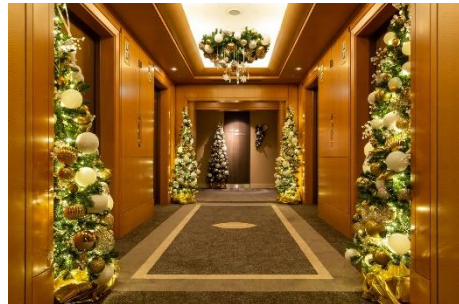
華やかなデコレーションが目を惹くクリスマスフロアのエレベーターホール