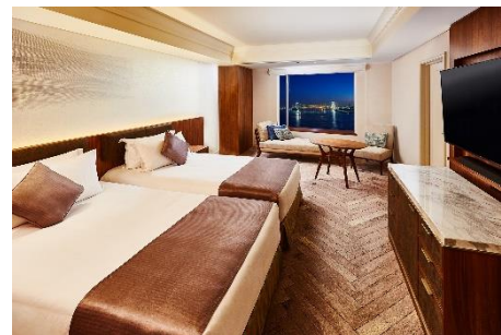
通常ルーム(イメージ)