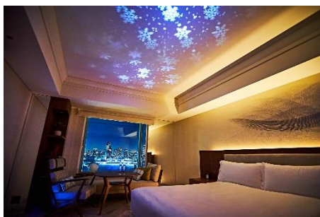
スノーホワイトルーム(イメージ)