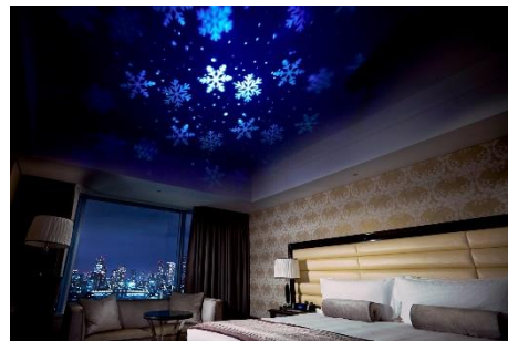
スノーホワイトルームには幻想的な雪の結晶が投影される