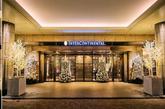
ホテル館内はエントランスやロビーなどクリスマスデコレーションが施される

ホテル インターコンチネンタル 東京ベイ(所在地: 東京都港区海岸 1丁目16番2号、総支配人: 宮田 宏之)では、12月1日~12月25日まで、期間限定でクリスマスのデコレーションが施された「クリスマスフロア」が登場し、東京湾に架かるレインボーブリッジやリトルマンハッタンと称される隅田川の夜景をお楽しみいただきながら、大切な方と思い出に残る特別な夜をお過ごしいただける多彩な「クリスマスステイプラン」をご用意いたしました。