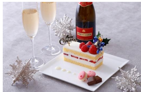
クリスマスケーキとスパークリングワイン(イメージ)