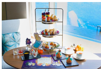
客室でのアフタヌーンティー(イメージ)