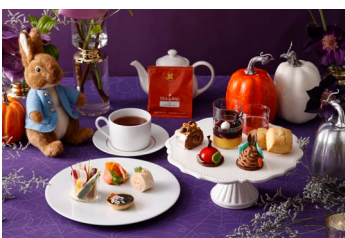
ご自宅でも世界観をお楽しみいただける テイクアウトBOX