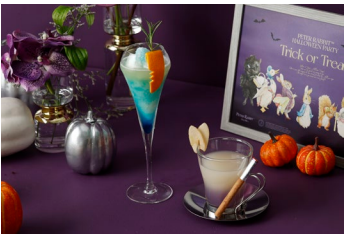
絵本をイメージしたスペシャルドリンク