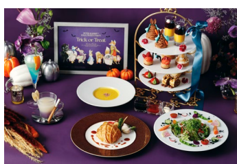
セイボリーの代わりにサラダ・スープ・パイが付いたスペシャルディナー