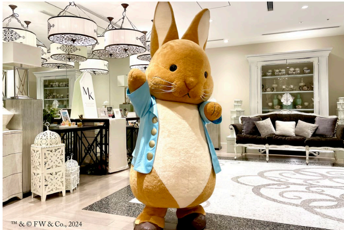
ピーターラビットに会えるイベントを日程限定で開催(写真はイメージ)