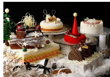
心躍るフェスティブシーズンを彩るスタイリッシュで華やかなクリスマスケーキをラインナップ