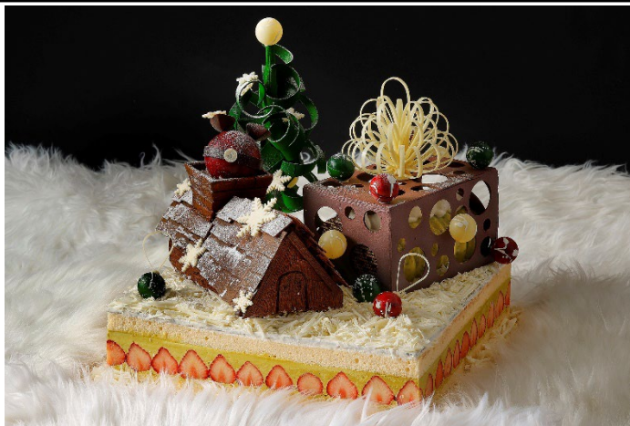
10セット限定で販売のスペシャルクリスマスセット 「Ho! Ho! Ho! ~あわてんぼうのサンタクロース~」