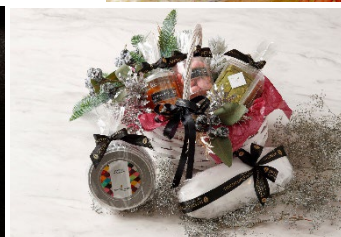
クリスマスギフト