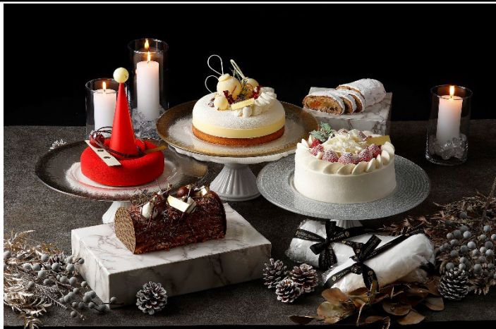
帝国ホテルや海外で経験を積んだエグゼクティブ シェフ パティシエ永井が 監修した初のクリスマスケーキ&スイーツコレクション