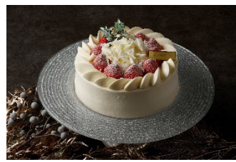
ホワイトクリスマスショートケーキ18cm