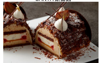
ブッシュ・ド・モンブラン 断面図