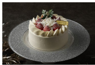
ホワイトクリスマスショートケーキ15cm