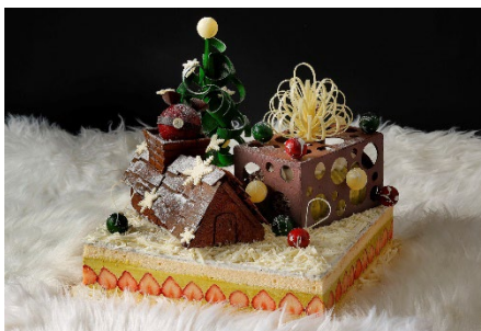
Ho! Ho! Ho! ~あわてんぼうのサンタクロース~