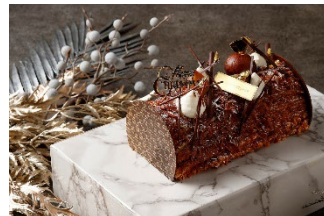
ブッシュ・ド・モンブラン