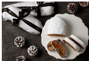
シュトーレンは2種類のサイズをご用意