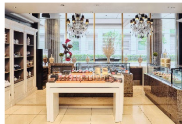
ザ・ショップ N.Y.ラウンジブティック 内観

1F ロビーフロアのザ・ショップ N.Y.ラウンジブティックでは、専属のパティシエが手掛けるスイーツや焼き菓子、ホテルオリジナルのタオル、アロマエッセンスなどのお土産品を販売しております。アフタヌーンティーセットやお弁当、パーティーセットなどのテイクアウト&デリバリー商品も揃えております。また、オンラインショップでは内祝いなどの贈り物におすすめの商品をラインナップ。全国へ発送を承ります。