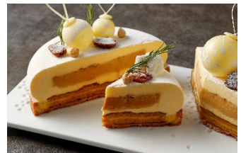
ノエル・プラリネ 断面図