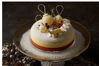
ノエル・プラリネ