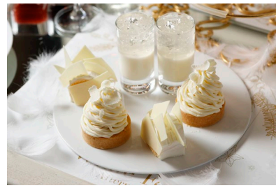
プティ・ガトー(イメージ)

【ドリンク】コーヒー4種、アイスコーヒー、アイスカフェオレ、アイスティー、日本茶2種、 クラシックティー3種、ハーブティー4種、フレーバーティー4種など全26種