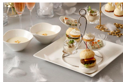
マンハッタンオリジナルのセイボリー