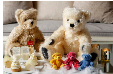
ニューヨーククラウンジ限定のテディベア付きプラン (イメージ)