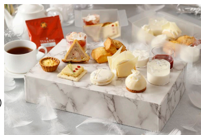
テイクアウト アフタヌーンティーBOX (イメージ)

【内容】プティガトー6種、スコーン2種、セイボリー5種、ドリンク(コーヒー、紅茶・ハーブティーなど8種)