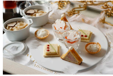
セイボリー(ラウンジ2店舗)