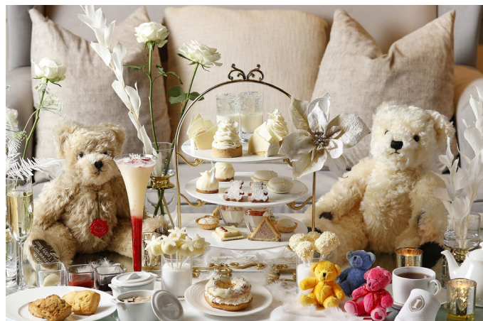
数量限定で<ハーマン・ティ>のティディベア付きプランをニューヨークラウンジで提供

場所: ニューヨークラウンジ、他4店舗、インルームダイニング、N.Y.ラウンジブティック