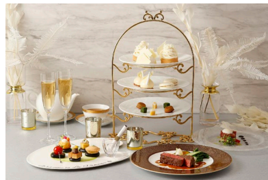
ラ・プロヴァンス アフタヌーンティー付きコース(イメージ)