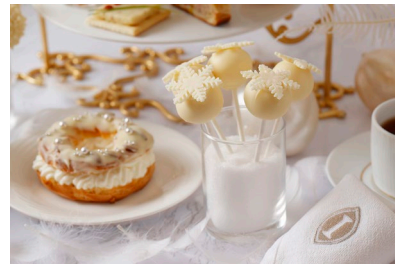
スペシャルディッシュとボンボンショコラ (イメージ)