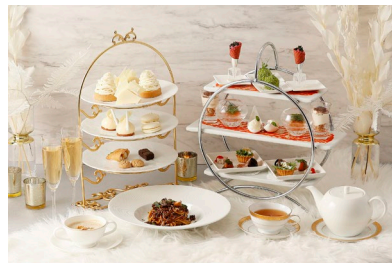
イタリアンダイニング ジリオン アフタヌーンティー付きコース(イメージ)

前菜5種盛り合わせ、スープ、パスタ、メインディッシュ、アフタヌーンティースタイルデザート(同上)