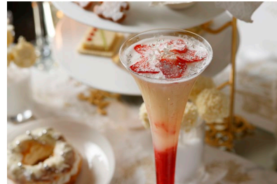
アフタヌーンティーをイメージした スペシャルドリンクをご用意