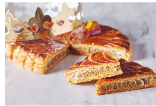
ガレット・デ・ロワ