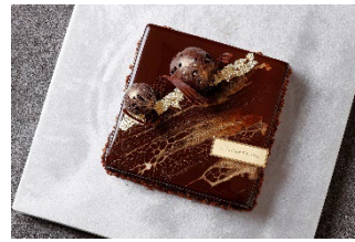
ソレイユ・ドウ・ショコラ

https://www.interconti-tokyo.com/boutique/sweets-takeout.html