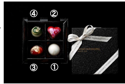
ボンボンショコラ「スパークルコレクション」4個入り

ホワイトチョコレートに自家製ピスタチオブラリネを閉じ込め、サクサクとした食感を演出。