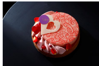
ふたりでシェアして楽しめるバレンタインケーキ

アモンドショコラとブラリーヌアモンド各1個、ストロベリーショコラとノワゼットショコラ各2個をセット