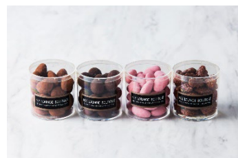
左からアモンドショコラ、ノワゼットショコラ、ストロベリーショコラ、ブラリーヌアモンド

ラズベリーのサンフアリーヌとクリームストロベリーをたっぷり詰めたタルト生地の上に、カシスとライチのジュレをしのばせた甘酸っぱいクランベリーのムースをのせたシェフ渾身の一品です。程よい甘味と滑らかな口どけのストロベリーガナッシュモンテを半月状にしぼり、ベルローズとグロゼイユ、フランボワーズパールクラクランを飾り、アーティスティックで華やかな大人のバレンタインケーキに仕上げました。