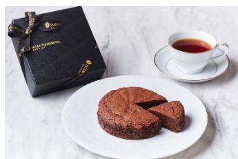
モワローショコラ