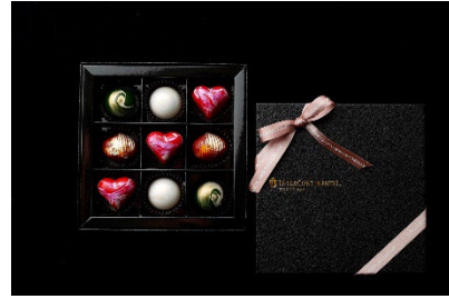
ボンボンショコラ「スパークルコレクション」9個入り