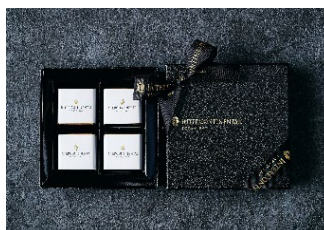
キャレショコラ(16枚入り)