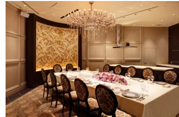
ラ・プロヴァンス個室(イメージ)