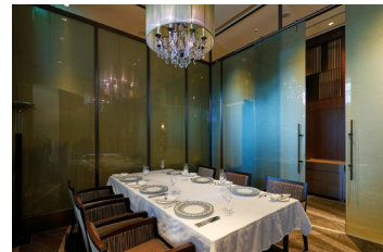
ジリオン個室(イメージ)