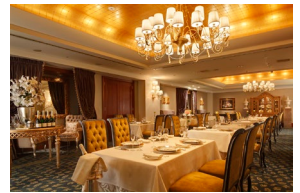
ラ・プロヴァンス 内観

南フランスの伝統的な料理を現代風にアレンジした“モダン・フレンチ”をお楽しみいただけます。常に食材が持つ味わいを最大限に引き出すことを意識し、美味なる料理を導き出すことを目指し料理に取り組んでおります。中世プロヴァンスの貴族別荘をイメージさせる落ち着いたダイニングで洗練されたお料理とサービスをご提供いたします。また、ビジネスのご会食や接待、ご家族の大切な記念日などにご利用いただける個室も備えております。