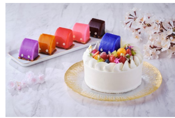
6色から選べるランドセルケーキをご用意