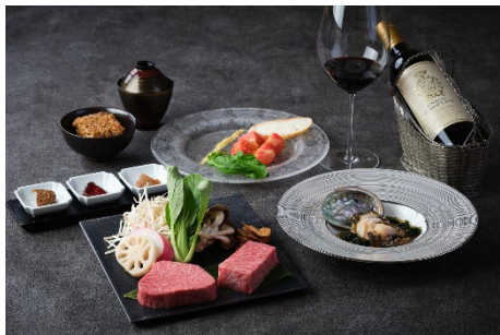
鉄板焼 匠では飽のグリルやロースとヒレの食比べができるコースを提供(レストランプラン)