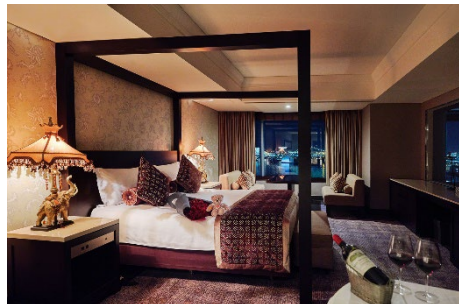
宿泊はデザイナーズスイート&ルームを用意