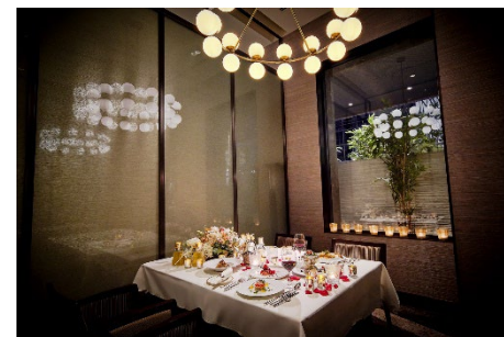
ジリオン(写真上)とラ・プロヴァンス(写真下)では個室にて記念日を祝うプランが登場