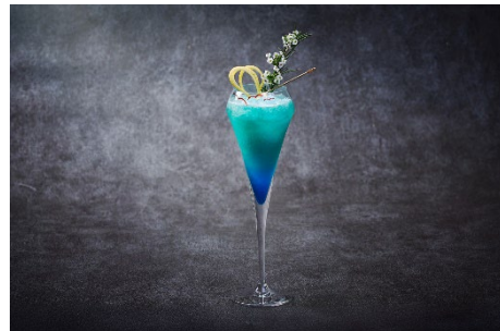
ハドソンラウンジで提供する30周年記念カクテル

ホテル開業30周年を迎え、心からの感謝の気持ちを込めた記念カクテルです。東京湾から美しい朝陽が昇り、輝く青い海と空を象徴するブルーの色合いに、30年間の歴史を感じさせる年輪を描くようにこれまでの感謝を3つの輪で表現しました。未来に向かう希望の象徴として、大きな海を渡っていくカモメをグラスに。華やかでフルーティなシャンパンの味わいと共に、白いお花と金箔を添えた祝福のカクテル「Timeless Thirty」をお愉しください。 料金: ¥3,000 *税金込み、サービス料別