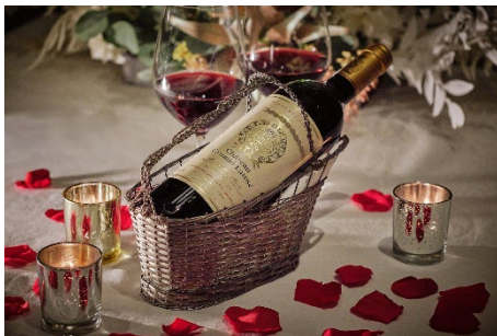
1995年 ボトルワイン「シャトー・グリュオ・ラローズ」(レストランプラン)