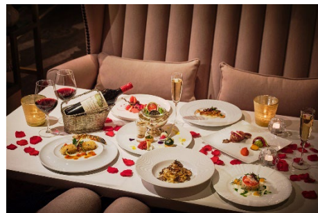
宿泊プランでは特別ディナーを3つのレストランから選べる