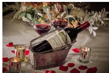
1995年ヴィンテージ赤ワインをレストランで楽しめる(宿泊プラン)