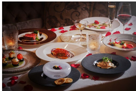
高級食材や旬の食材をアレンジした全8品のコース(ラ・プロヴァンス)