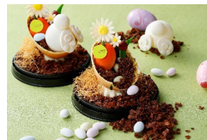
たまごの器の中にはドラジェが埋まっている

イースターバニーのエッグハントチョコレート ¥3,800 * 賞味期限は製造日から1カ月間