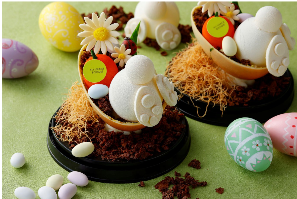
4月20日のイースターに向けて、春の庭でエッグハントを楽しむイースターバニーを表現したイースターエッグチョコレートを販売

期間: 2025年4月1日(火)～4月30日(水) 場所: ザ・ショップ N.Y.ラウンジブティック