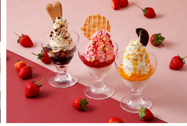
シェフズスペシャルパフェ