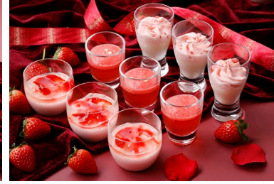
いちご尽くしのベリーヌは、 4月1日～一部メニューが変更に