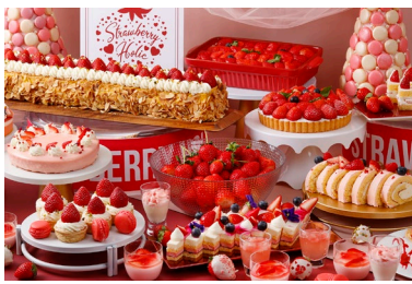
4月1日～は、ピンクカラーのスイーツが登場