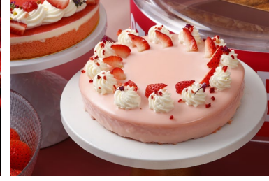
マスカルポーネフレーズ