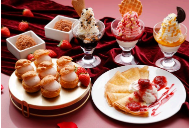
焼きたてのクレープやシュークリームなど カスタマイズコーナーがさらに充実