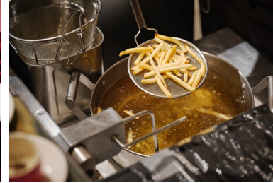
フレンチフライは揚げたてを提供