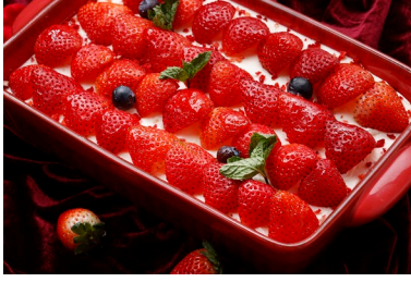
ストロベリームース