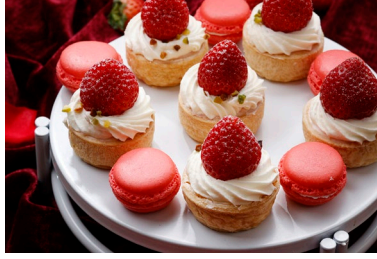
いちごタルトとあまおうマカロン