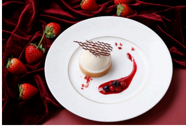
クリームダンジュ&ベリーコンポート