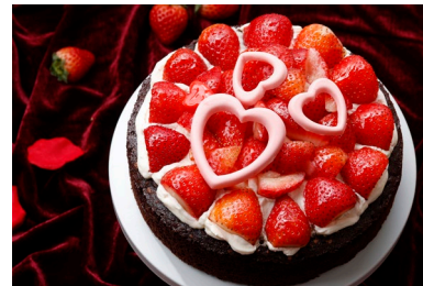
ストロベリーガトーショコラ