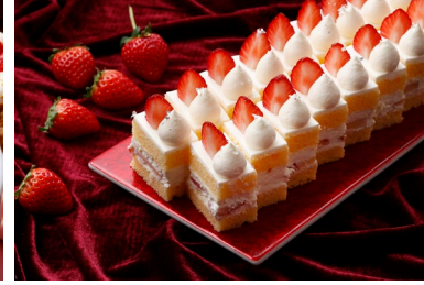
ストロベリーショートケーキ