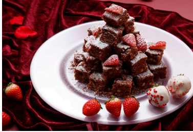
チョコレートブラウニー