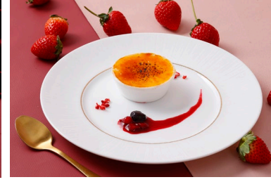
クリームブリュレ