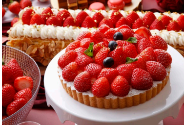
いちごをたっぷりと敷き詰めたタルト