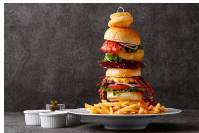
高さ約30cmのボリューム

https://www.interconti-tokyo.com/dining/plan/towerburger.html