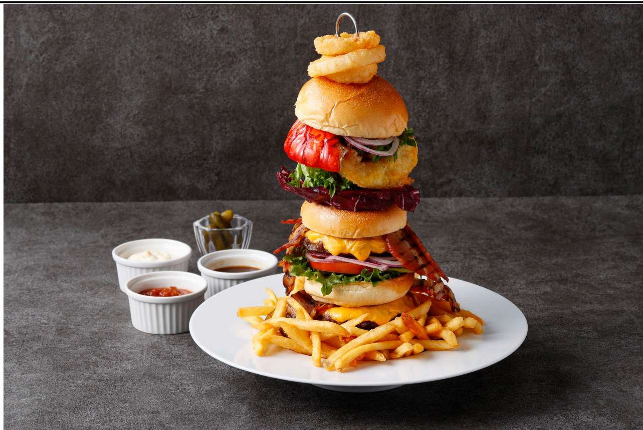
フレンチシェフが手掛ける、圧倒的存在感のある夢のような「ゴージャスタワーバーガー」

期間: 2026年1月1日(木)～2月28日(土) 場所: ニューヨークラウンジ、ハドソンラウンジ