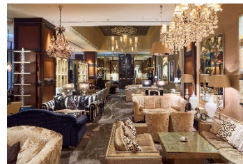
ニューヨークラウンジ 内観

上質なインテリアの中にゆったりとお掛けいただけるソファ席を配した華やかな店内では、見た目にも鮮やかな美食を提供します。一角に設けられたデザート工房「アトリエ・デセル」で仕上げられるアフタヌーンティーやパフェ、パンケーキなどのスイーツの他、サンドイッチやハンバーガー、各種御膳など、軽食からしっかりしたお食事までさまざまな用途に対応できるバラエティ豊かなメニューをご用意しております。各種アルコールも取り揃えておりますので、夜はバーラウンジとしてもお楽しみいただけます。