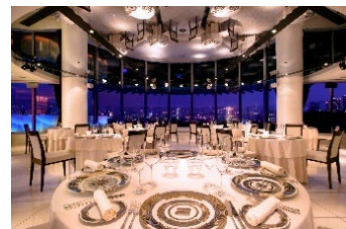
マンハッタン内観

東京を代表するレインボーブリッジ、東京スカイツリー、隅田川の夜景をお楽しみいただけるダイニングエリアでは、〈N.Y.グリルフレンチ〉のコーススタイル、テラスエリアでは〈シャンパンバー〉と2つのハイセンスなエリアをご用意しておりますので、お客様のその日の気分、目的にあわせてご利用いただけます。