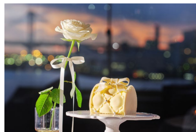
「Sweetie White」(メッセージ付き)と ホワイトローズなどの特典付き

[添付資料] 店舗紹介、ホテル概要、インターコンチネンタルホテルズ & リゾーツについて