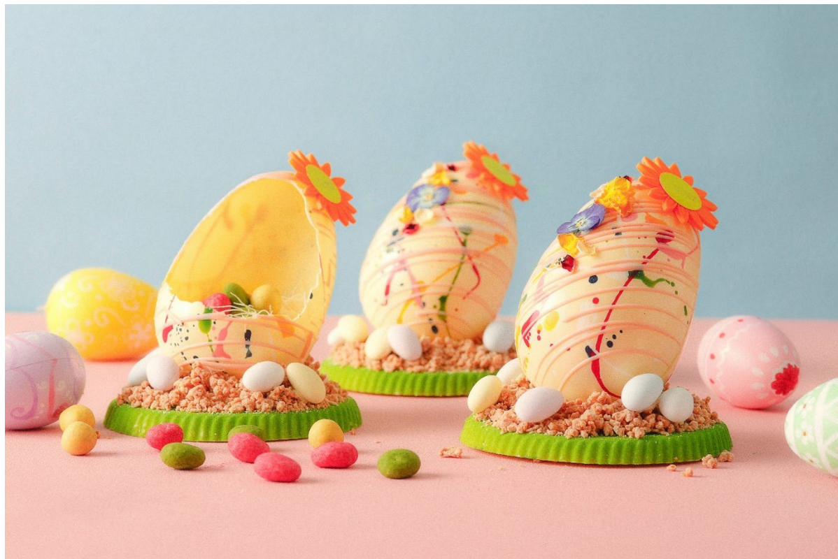
4月5日のイースターに向けて、ドライフラワーで彩られたカラフルなイースターエッグチョコレートの販売

期間: 2026年3月1日(日)～4月5日(日) 場所: ザ・ショップ N.Y.ラウンジブティック