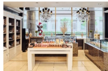
ザ・ショップ N.Y.ラウンジブティック 内観

1F ロビーフロアのザ・ショップ N.Y.ラウンジブティックでは、専属のパティシエが手掛けるスイーツや焼き菓子、ホテルオリジナルのタオル、アロマエッセンスなどのお土産品を販売しております。アフタヌーンティーセットやお弁当、パーティーセットなどのテイクアウト&デリバリー商品も揃えております。また、オンラインショップでは内祝いなどの贈り物におすすめの商品をラインナップ。全国へ発送を承ります。