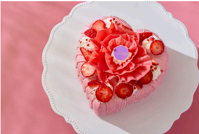
愛らしいハート型が目を惹く、華やかな母の日ケーキ

ホテル インターコンチネンタル 東京ベイ(所在地: 東京都港区海岸1丁目16番2号、総支配人: 宮田 宏之)では、ザ・ショップ N.Y.ラウンジブティックにて、ご家族皆さままでのお祝いのひとときを演出する、お子様から大人の方まで世代を問わず愛されるショートケーキをベースに仕立てた華やかな「こいのぼりケーキ」と「母の日ケーキ」を期間限定で販売いたします。