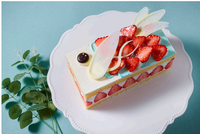
1パックを超えるいちごを使用した贅沢なこいのぼりケーキ

販売期間: 2026年4月11日(土)～5月10日(日) 場所: ザ・ショップ N.Y.ラウンジブティック