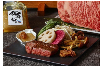
福岡県内最古のブランド牛の一つ 「筑穂牛」が楽しめる