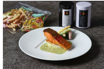
豊前市産みらいサーモンのグリル 八女茶香る白ワインソース