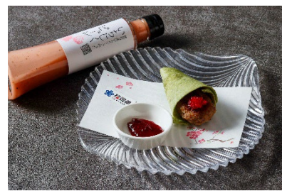
みやこ町で捕れた新鮮なイノシシ100%と季節のジャムを合わせたトルティーヤ