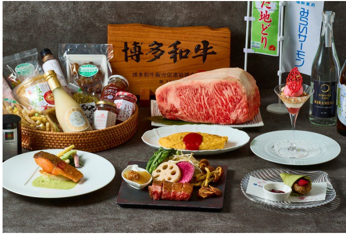
料理長厳選の福岡の恵みを味わい尽くす スペシャルランチ&ディナーコースが登場