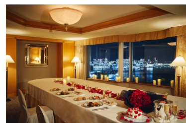
窓一面から美しい夜景を望む 贅沢な貸切空間