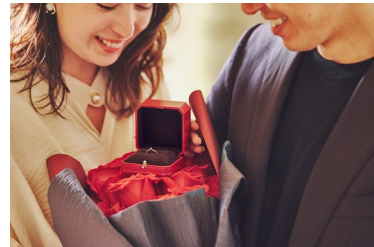
一生に忘れられない瞬間を