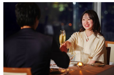
ベイビューで贅沢ディナーを満喫

おふたりのリクエストに合わせたオリジナルカクテルを召し上がり、 フラワーBOXとともにプロポーズをしていただきます。