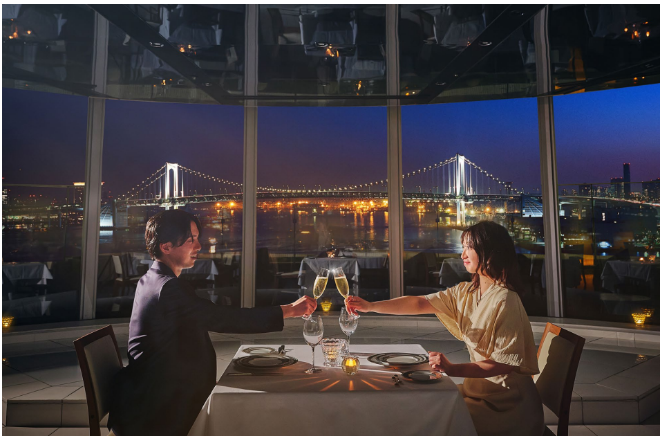
美しい夜景が広がるオーシャンビューダイニングでロマンチックなひとときが過ごせる東京ベイサイドプロポーズ

期間: 通年提供 場所: レインボーブリッジビューダイニング&シャンパンバー マンハッタン