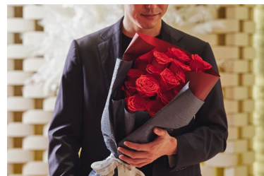
赤バラ21本の花言葉は「真実の愛」