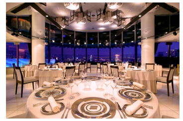
マンハッタン内観

レインボーブリッジなどの東京湾岸の眺望をお楽しみいただけるレストラン。 (N.Y.グリルフレンチ)のコーススタイルを提供するダイニングエリアと、〈シャンパンバー〉のテラスエリアをご用意しております。フランス料理をベースにした、本場ニューヨークのグリル料理の文化「熟成」を取り入れたスタイルをお楽しみいただけます。