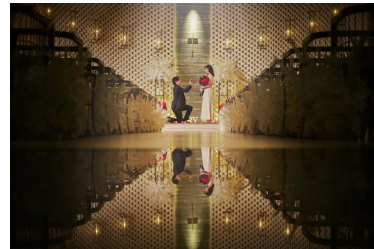
柔らかな光が包み込む 神聖なチャペルでプロポーズ