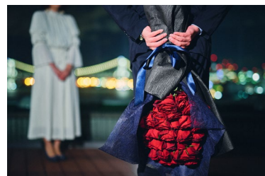
レインボーブリッジの夜景を背景に ドラマティックなプロポーズ