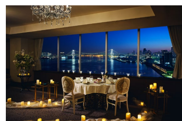
キャンドルに包まれた貸切空間でサプライズ